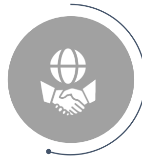
设立财富传承信托

国际化的背景，奠定了彦德国际（InCorp International）家族办公室业务的地位，团队汇聚了全球资深私人银行家、特许金融分析师、会计师、律师、精算师、财富规划师、投资专家、信托专家等各领域精英，已为多个家族构建家族财富管理系统，涵盖私人银行、控股公司、家族基金、家族信托与家族基金会等内容。