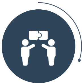
基金管理公司 及基金实体设立